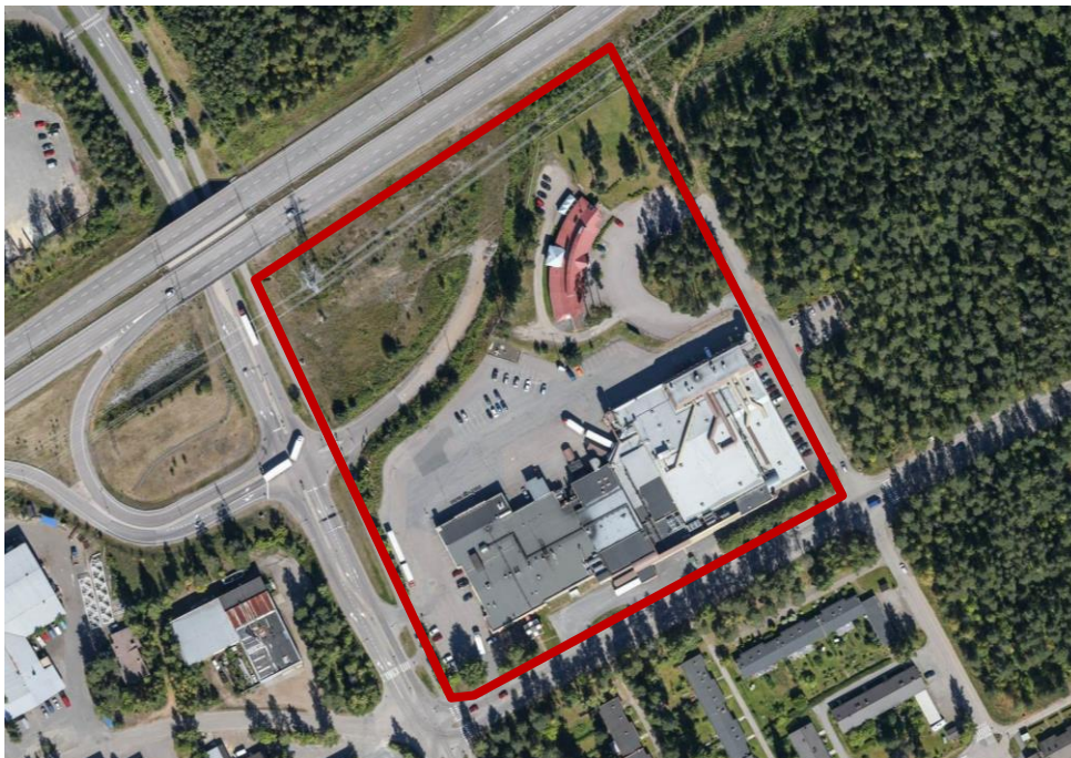
Kuva 2 Kaavamuutosalueen aluerajaus ilmakuvassa

Asemakaavamuutoksen tavoitteena on mahdollistaa Lantmännen Unibaken tontin ja tuotantorakennuksen kokonaisvaltainen kehittäminen ja lisärakentaminen sekä päivittää asemakaava vastaamaan alueen nykyisiä tarpeita. Samalla parannetaan alueen liikennejärjestelyjä.