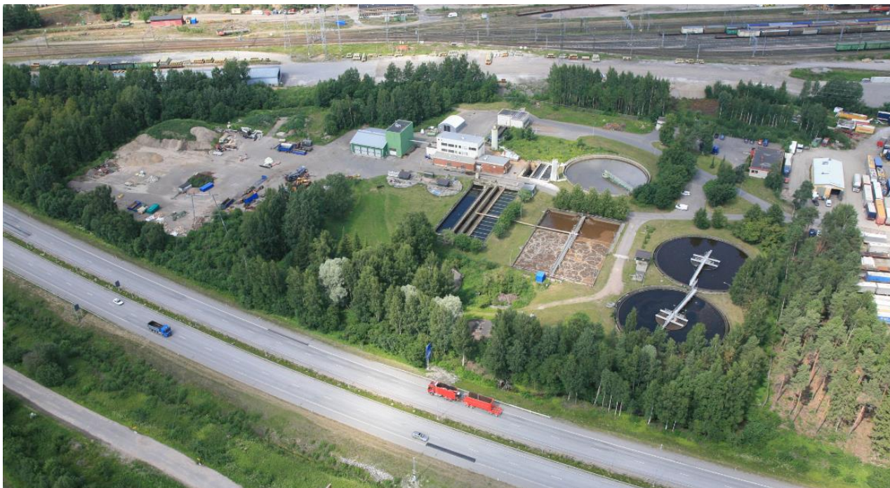
Vuoden 2018 viistoilmakuva suunnittelualueesta.

Suunnittelussa huomioidaan alueen sijainti vilkkaiden liikenneväylien ja energiaverkoston keskellä sekä lähimpien asuinalueiden asukkaat.