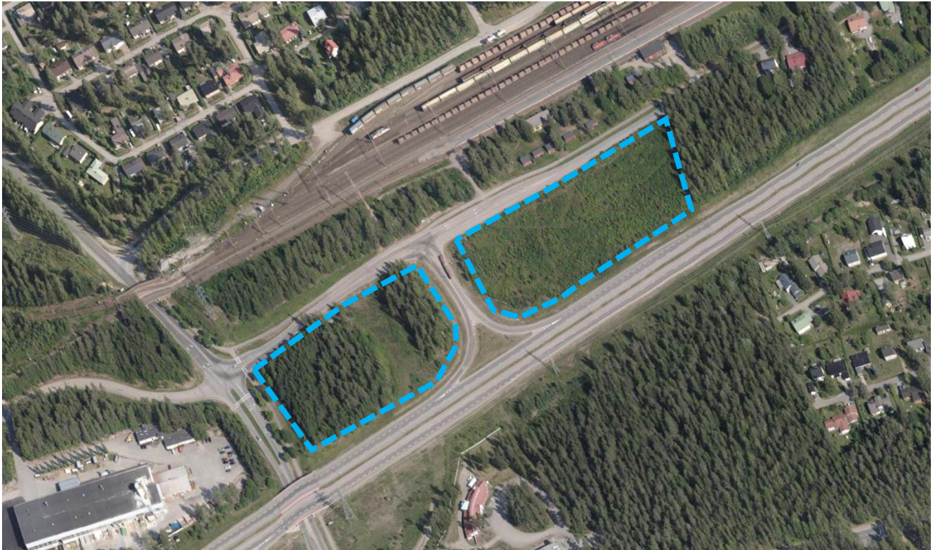
Kuva 2. Ortoilmakuva alueelta vuodelta 2018. Kaavamuutosalueet on rajattu sinisellä katkoviivalla.